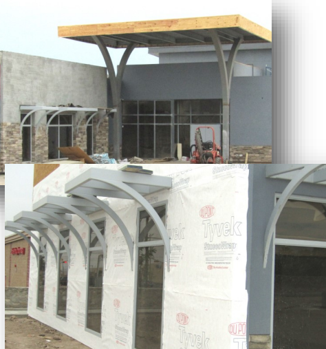
Fotos de la construcción en junio.

Para ver los comentarios completos del consultor de construcción, visite el sitio web del Fondo en www.eppension.org y seleccione " Reuniones ". Reuniones de la Junta son transmitidas en vivo y archivadas en línea.