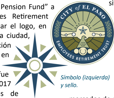
Simbolo (izquierda) y sello.

Jubilaciones aprobadas por la Junta de Síndicos del City of El Paso Employees Retirement Trust entre diciembre 2017 y mayo 2018. Page 4