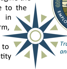
Trust’s icon (left) and seal.

Net position held in the Trust for pension benefits (net position) increased during the fiscal year 2017 by $53.3 million. The major reason for the increase in net assets was due to the performance of the capital markets, which resulted in net investment gain of $75.3 million. Employer and plan member contributions totaled $40.5 million,