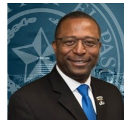
Rep. Sam Morgan Distrito 4

Morgan sirvió a su país honorablemente durante los veintinueve años en las fuerzas armadas de los EE UU en las filas de alistado y oficial. Se retiro como comandante en el 2006. Fue durante su tiempo en uniforme